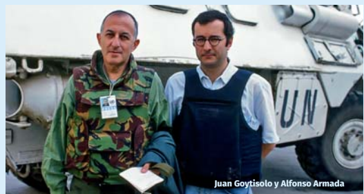
Juan Goytisolo y Alfonso Armada

«Del mismo modo que necesitamos morir para darle pleno sentido a la vida, es preciso convertirse en padre o hacer de padre para ponerse en su lugar. Así aprendí a conocer y a apreciar a los soldados españoles: viéndoles actuar en zona de conflicto. Yo era pacifista hasta que (...) me di cuenta de que la equidistancia no era posible cuando hay víctimas y verdugos (...) conocí de primera mano el desempeño de los militares españoles (...). Me admiró la entereza de los mandos y los soldados españoles desplegados en la región. (...) son la cara más profesional de un Ejército que, desde Bosnia a Irak, pasando por Afganistán y Pakistán, han demostrado su capacidad para propiciar "empatía" con la población civil.»